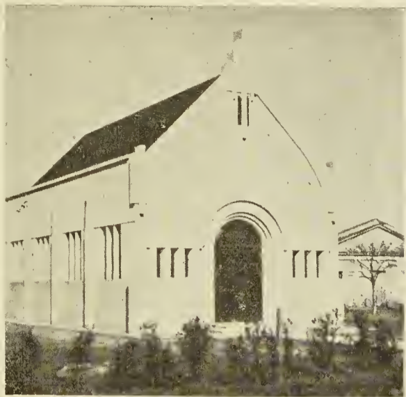
El Templo de la Iglesia Evangélica Valdense de Colonia Belgrano (Prov. Santa Fe, R. A.)